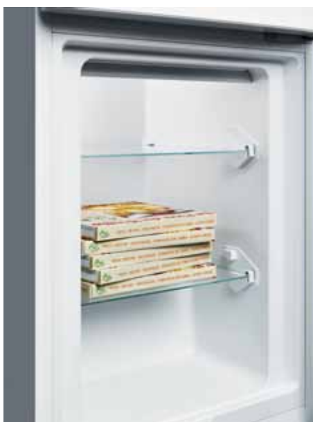
Sfrutta tutto lo spazio.