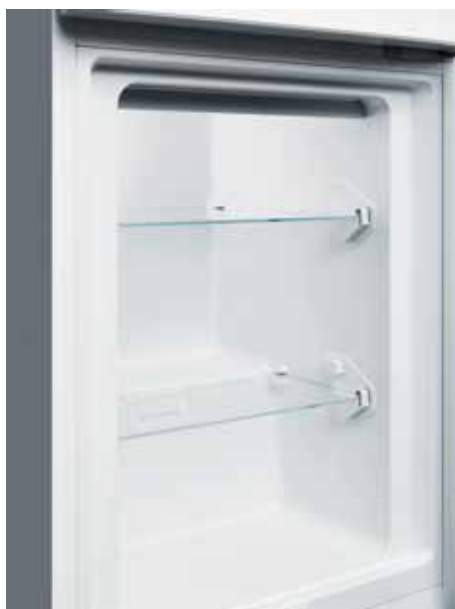
Con o senza cassetti.